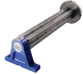
Yatak = Nr.2460